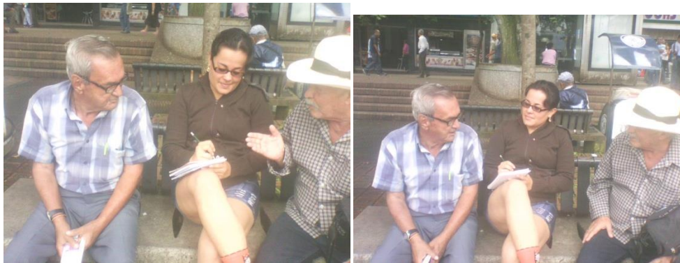
Entrevistas sobre uso y significado del espacio