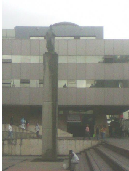
Estatua homenaje a El libertador