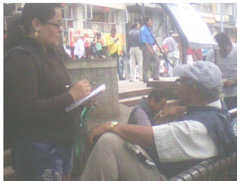
Entrevistas a adultos mayores