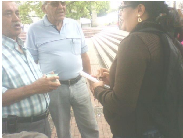
Entrevistas con adultos mayores