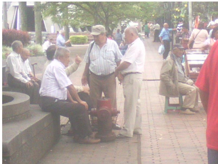
Adultos mayores interactuando cerca a vendedores de tinto