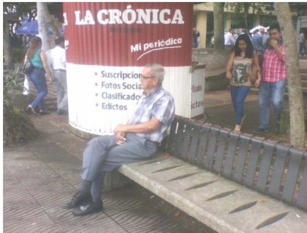
Descanso en la plaza, una actividad cotidiana y de uso del espacio