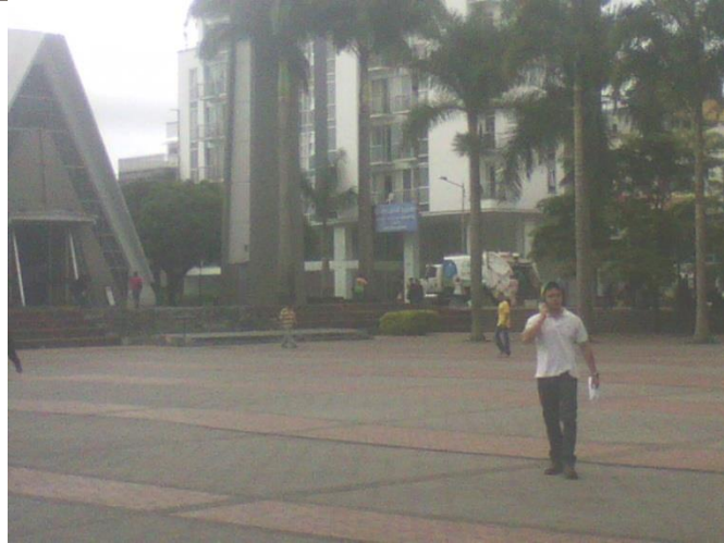
Vistas de la catedral (edificio importante y significativo de la Plaza de Bolívar) y de uno de los edificios que rodea la plaza de bolívar (torre 21 a construido recientemente)