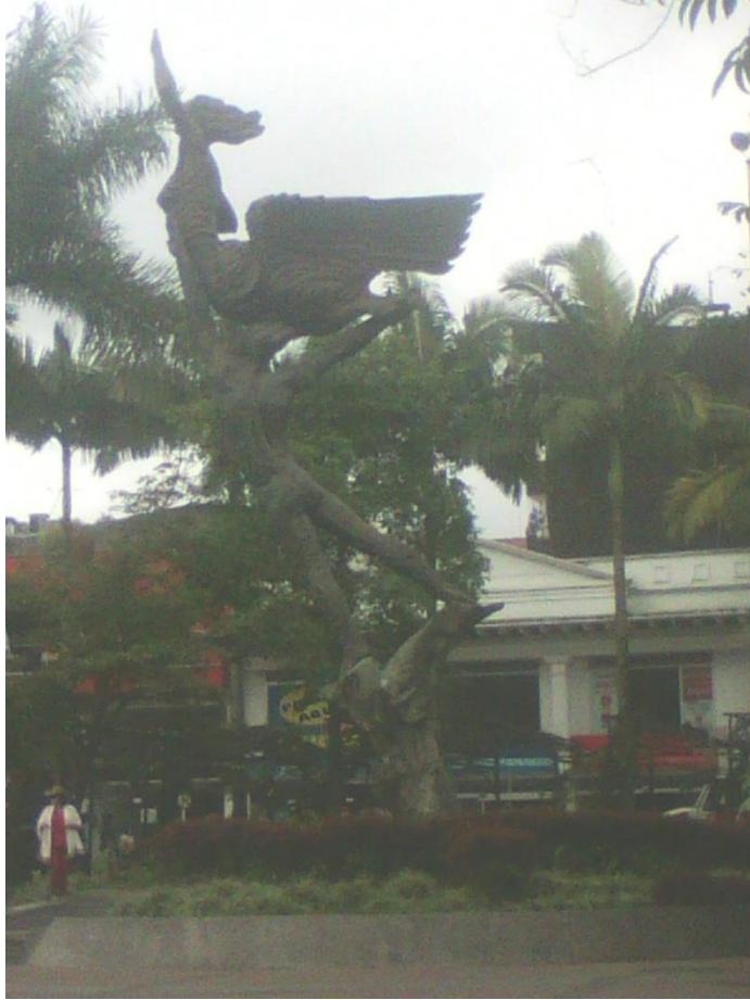
El Monumento al Esfuerzo, obra del maestro Rodrigo Arenas Betancourt, hecho en homenaje al pueblo quindiano y que la mayoría de los adultos mayores identifican en este contexto