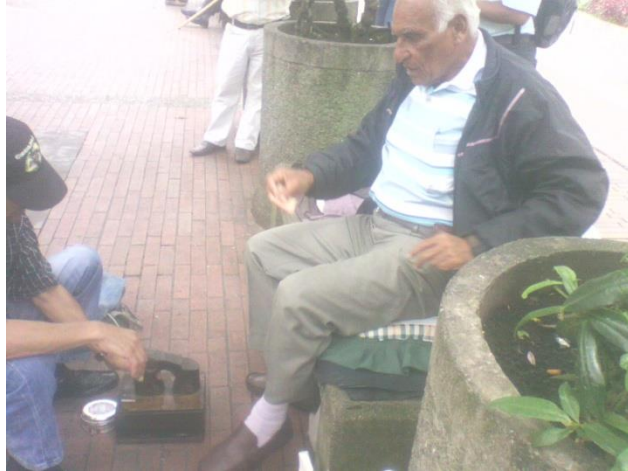
Adulto mayor utilizando los servicios de un lustrabotas en la Plaza de Bolívar