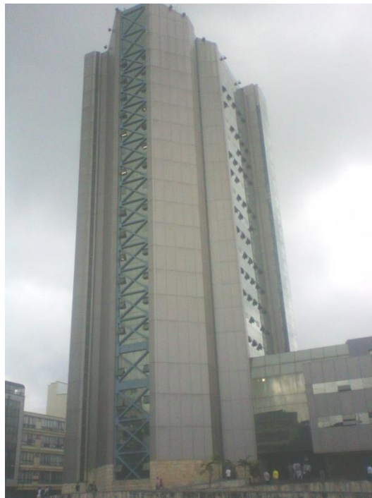
Gobernación del Quindío, edificio emblemático de la plaza