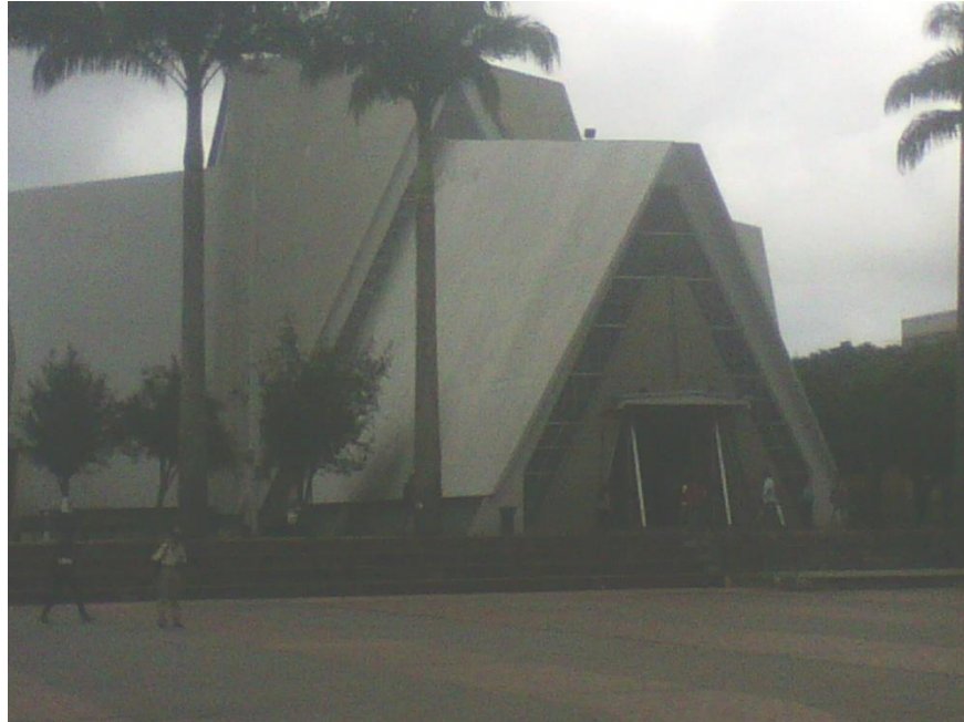
La catedral de Armenia (Q) símbolo religioso de la ciudad