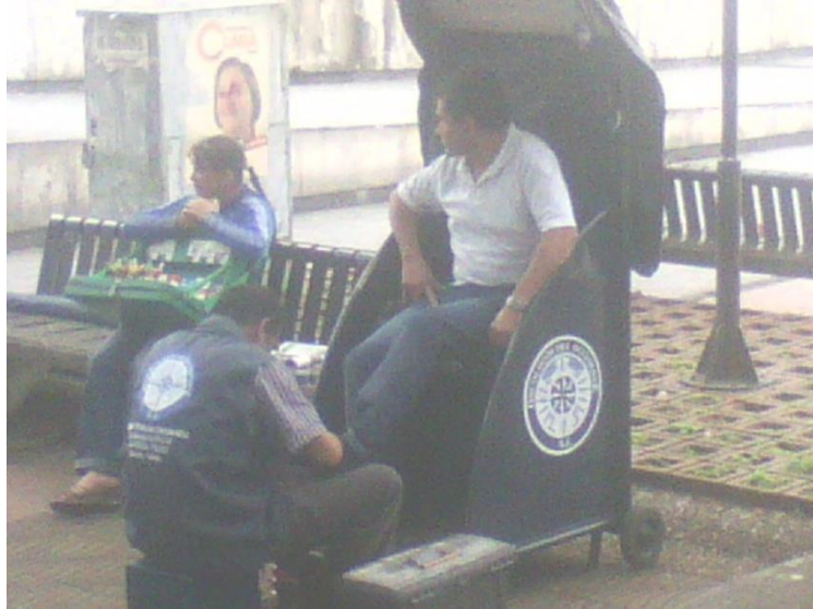
Adulto mayor embetunado zapatos