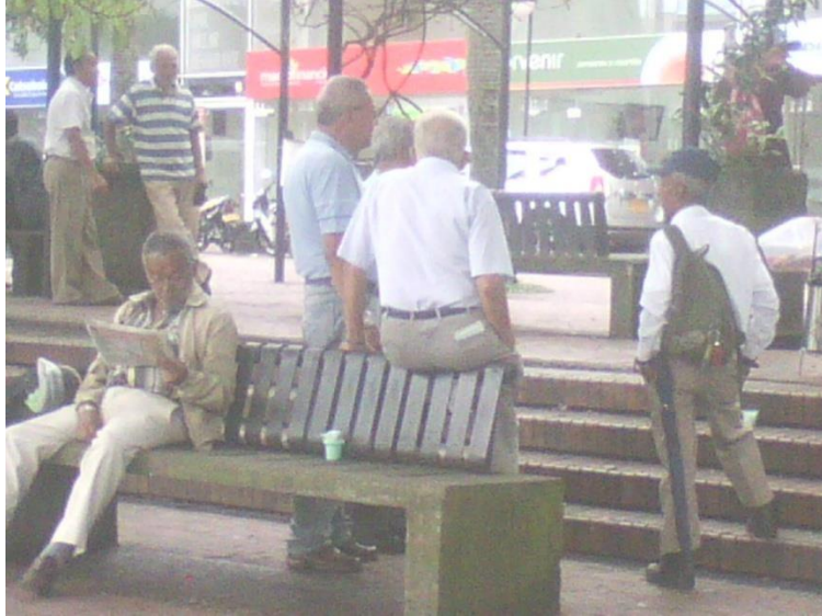
Interacción social en el espacio público urbano