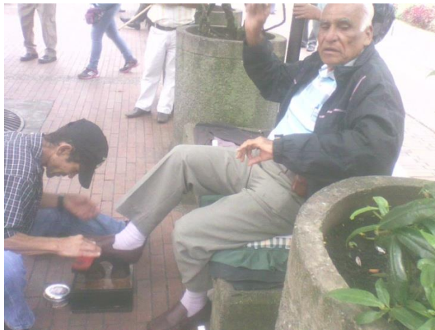
Adulto mayor utilizando los servicios de un lustrabotas en la Plaza de Bolívar