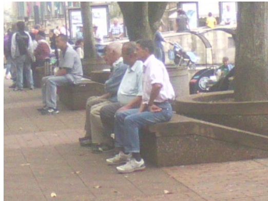
Interacción social, charlas en la plaza