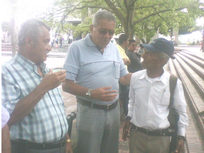
Interacción social y procesos comunicativos en el adulto mayor